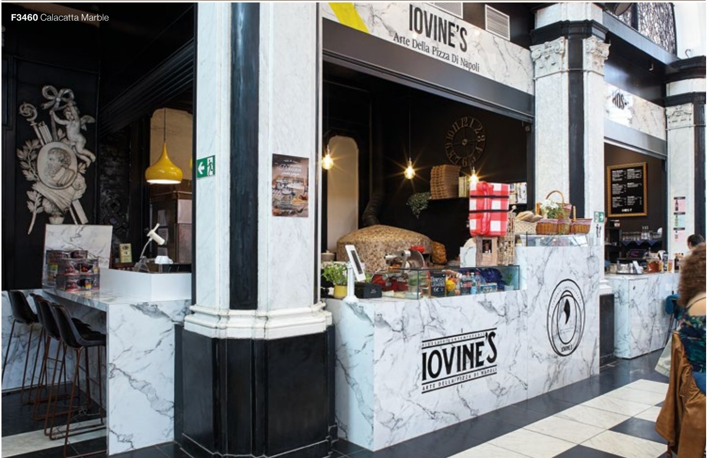
F3460 Calacatta Marble

Formica Laminaat Calacatta Marble geeft een eigentijdse uitstraling aan de vloer, trekt licht aan en contrasteert uitstekend met het zwarte lakwerk. Boven integreert het op braziliaans graniet geïnspireerde Blue Storm natuurlijk met de onvolprezen ontwerpaanpak die aanzet tot het veranderen naar een mijlpaal in het nachtleven voor zowel Gentse inwoners als internationale toeristen.