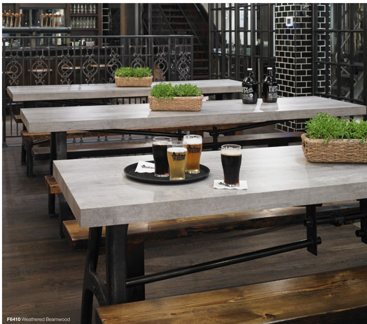
F6410 Weathered Beamwood

Voeg de laatste afwerking toe met aangepaste oppervlakken in uw hotelbar of restaurant. Geniet van houtsoorten, patronen en trendy kleuren in zowel standaard HPL en compact klasse laminaat.