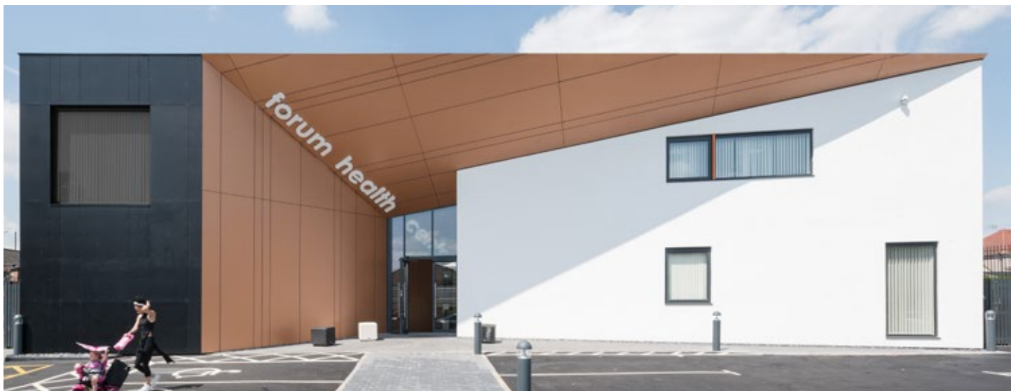
F4161 Terracotta F2253 Diamond Black

Dekorativt på begge side blev de 6 mm tykke VIVIX® paneler i Diamantsort anvendt på bygningens eksteriør for at skabe en visuel kontrast imod det hvide. Fra det funktionelle perspektiv bidrager VIVIX paneler til en bygningstermisk effektivitet, når det bliver brugt som en del af et regnskylsventileret system.